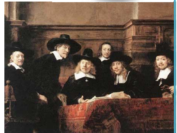
גילדת סוחרי בדים, רמברנט (1662)